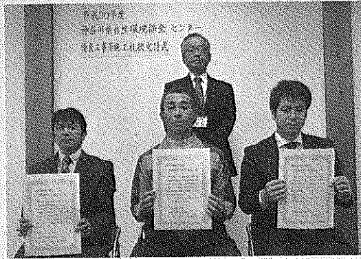
交付式に出席した3社の関係者

自然環境保全センターは1月29日、同センター(厚木市七沢)で優良工事と優良森林整備業務の各施工者に所長礼状を交付した。相模原と厚木の2市と箱根町、山北町の計4社を対象とし、困難な工事や業務の円滑な進行や無事故・無災害、事業の周知などの功績を称えた。